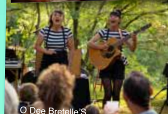
O Dee Bretelle'S